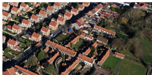
Réhabilitation de la cité des électriciens à Bruay-la-Buissière

Les PDR quant à eux consacrent plus de 5 % de leurs enveloppes FEADER au dispositif LEADER . Ce sont 17 territoires qui se constituent en Groupements d'action locale après avoir été sélectionné par appel à projet. L'année 2016 est marquée sur chaque versant par le travail d'accompagnement de ces territoires pour l'élaboration de leur convention et la formalisation des documents de mise en œuvre des GAL. Pour le Nord - Pas-de-Calais, 7 conventions avec l'autorité de gestion et l'organisme payeur ont pu être finalisées, pour le versant 2 GAL ont signés leur convention en 2016.